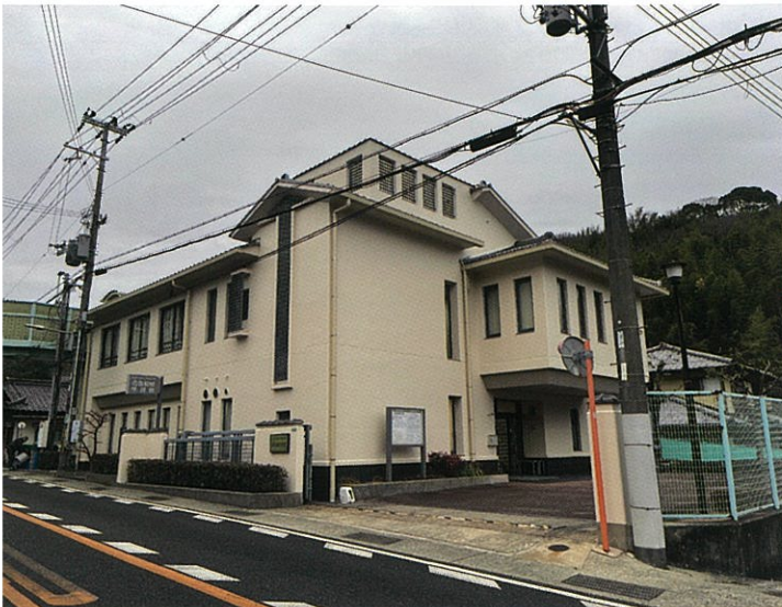
分館名塩和紙学習館

<西宮市立郷土資料館・名塩和紙学習館ホームページ> 西宮市 HP>文化・スポーツ・観光> 歴史と文化財>西宮市立郷土資料館