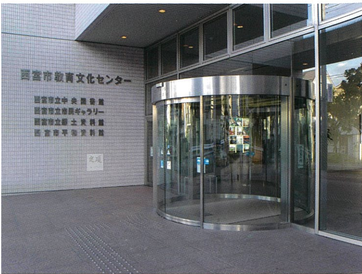
西宮市立郷土資料館

Japanese Paper Museum of Nishinomiya-Najio