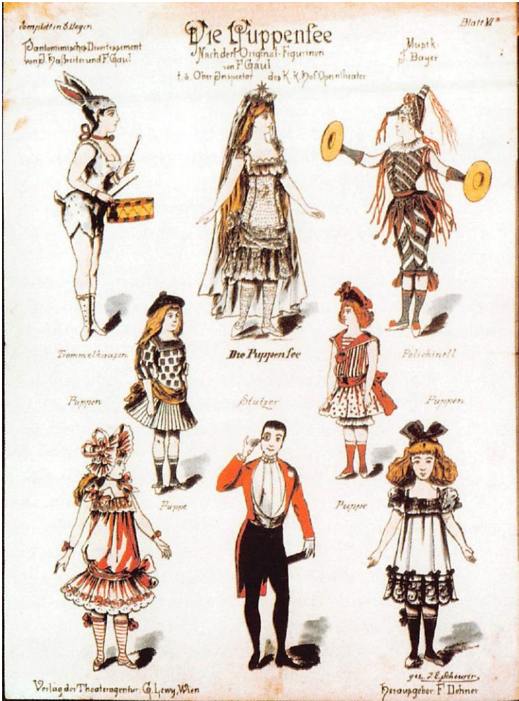
ウィーン国立歌劇場『人形の精』パンフレットより

舞踊史・舞踊理論研究。2000年より京阪神の上演芸術のフェスティバルに関わる。大阪大学文学大学院文学研究科文化動態論専攻アート・メディア論コース所属、准教授。大阪アーツカウンシル委員。