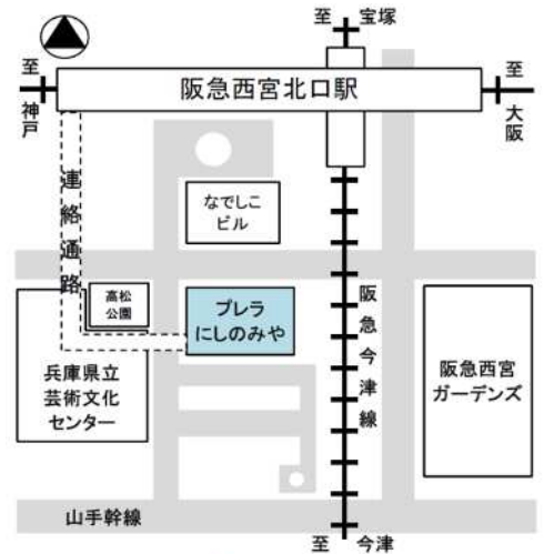
阪急西宮北口駅 南改札口から約200m 西宮市男女共同参画センターウェーブは プレラにしのみや 4階です

「思春期の子どもと 『もっと話をしたい』と思ったときの聞き方、尋ね方講座」 日時:2019年11月16日(土)13:00~15:00 会場:西宮市男女共同参画センター ウェーブ 411学習室 (プレラにしのみや4階)