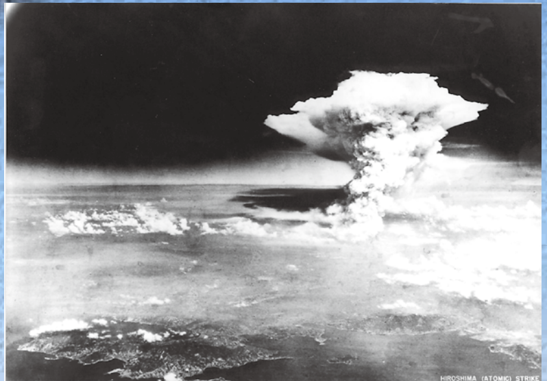
米軍機より撮影したきのご雲