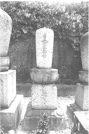
【写真11】 小松東墓地の名号石