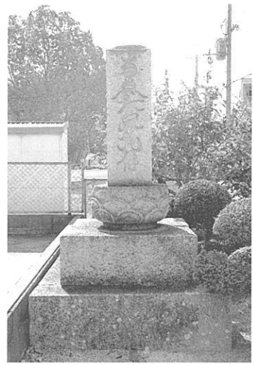
【写真7】 日野町の名号石