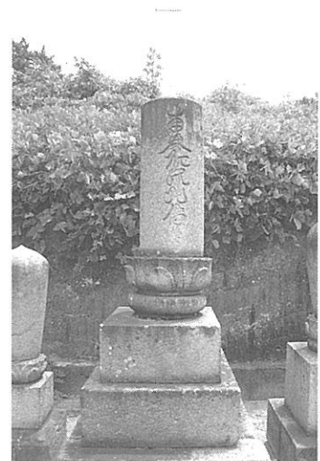
【写真10】 小松東墓地の名号石