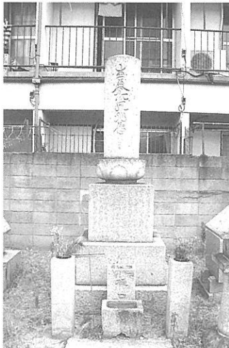
【写真9】 小松墓地の名号石