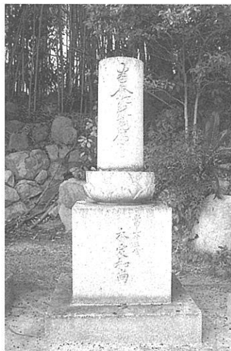
【写真12】 阿弥陀寺の名号石