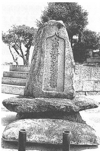
【写真18】 祐天の名号石(全景)