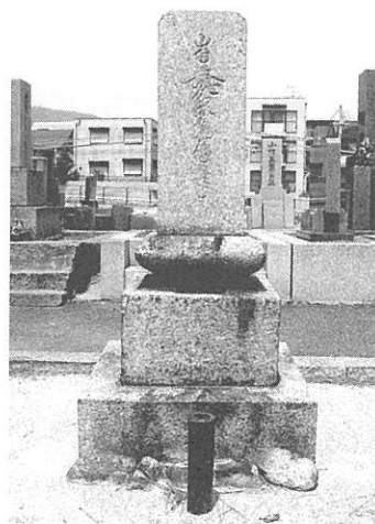
【写真16】 森具墓地の名号石