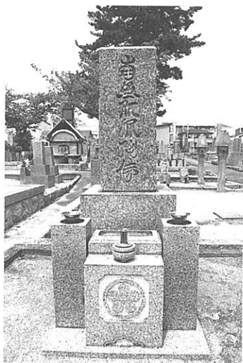
【写真17】 森具墓地の名号石