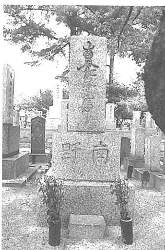
【写真15】 森具墓地の名号石