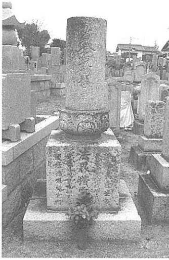
【写真6】 松並墓地の名号石