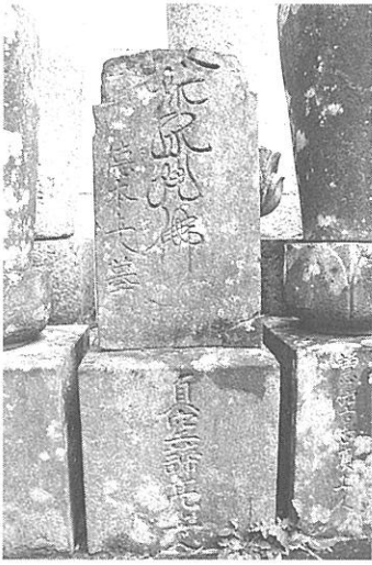
【写真5】 浄橋寺の名号石