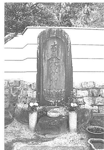
【写真13】 阿弥陀寺の名号石