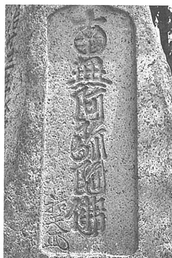
【写真19】 祐天の名号石(近景)

祐天（1637～1718）は浄土宗増上寺第36世の法主となった人物であり (10) 、祐天筆の名号石も徳本の比ではないが各地に建立されている。『徳本行者伝』によると祐天の六字名号を手本として徳本が名号の練習を行なったとする伝承が残されている。ちなみに、森具墓地入口には、祐天筆の名号石がもう1基存在している。