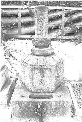
【写真8】 西方寺の名号石