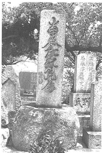
【写真14】 森具墓地の名号石