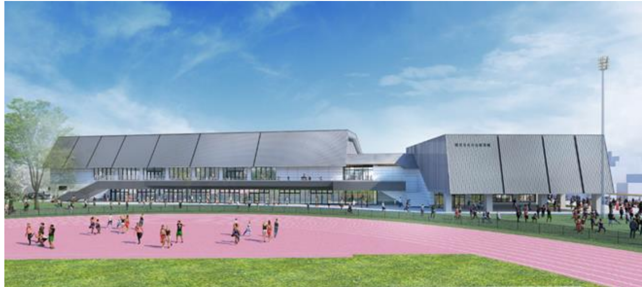
3分割できるメインアリーナ