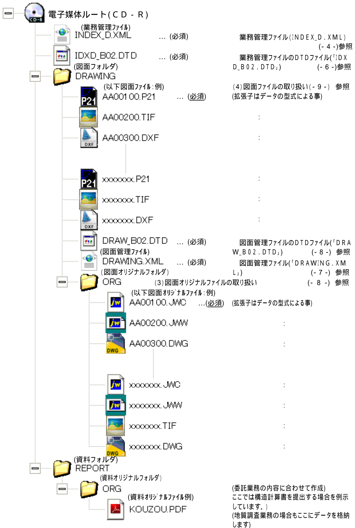
図 3-2-4 建築設計業務