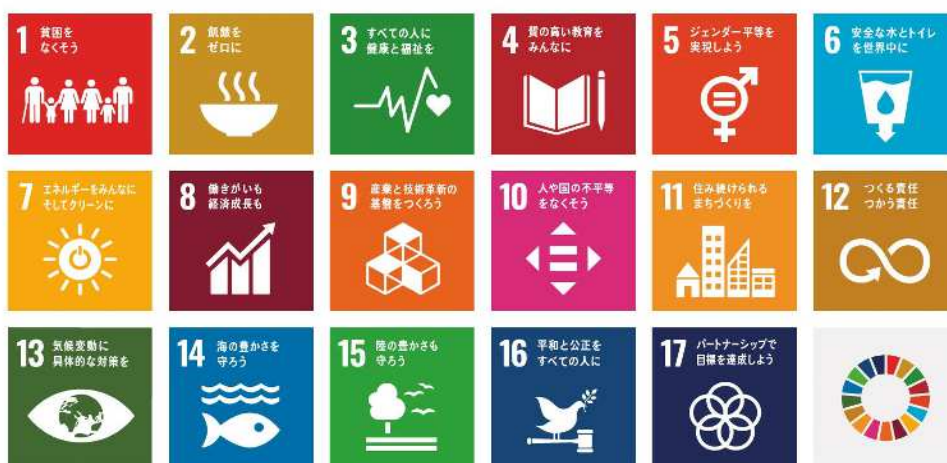
西宮市食品衛生監視指導計画とSDGsとの関係