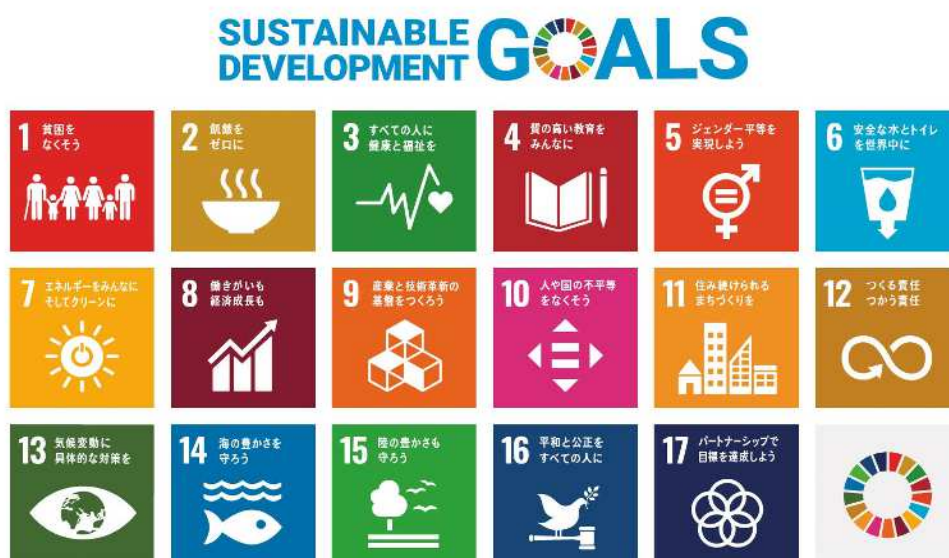
西宮市食品衛生監視指導計画とSDGsとの関係

平成27年の「国連持続可能な開発サミット」において、「持続可能な開発のための2030アジェンダ」とその17の「持続可能な開発目標（SDGs）」が採択されました。SDGs（Sustainable Development Goals）では、経済・社会・環境の3つの側面のバランスがとれた持続可能な開発に際して、複数目標の統合的な解決を図ることが掲げられています。本計画においては、市民、事業者、行政がそれぞれの役割を認識し、相互に連携・協働しながら取組みを進めることにより、特に以下に挙げるSDGsの3つの目標達成に寄与することが期待されています。