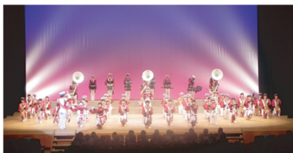
上甲子園中学校吹奏楽部