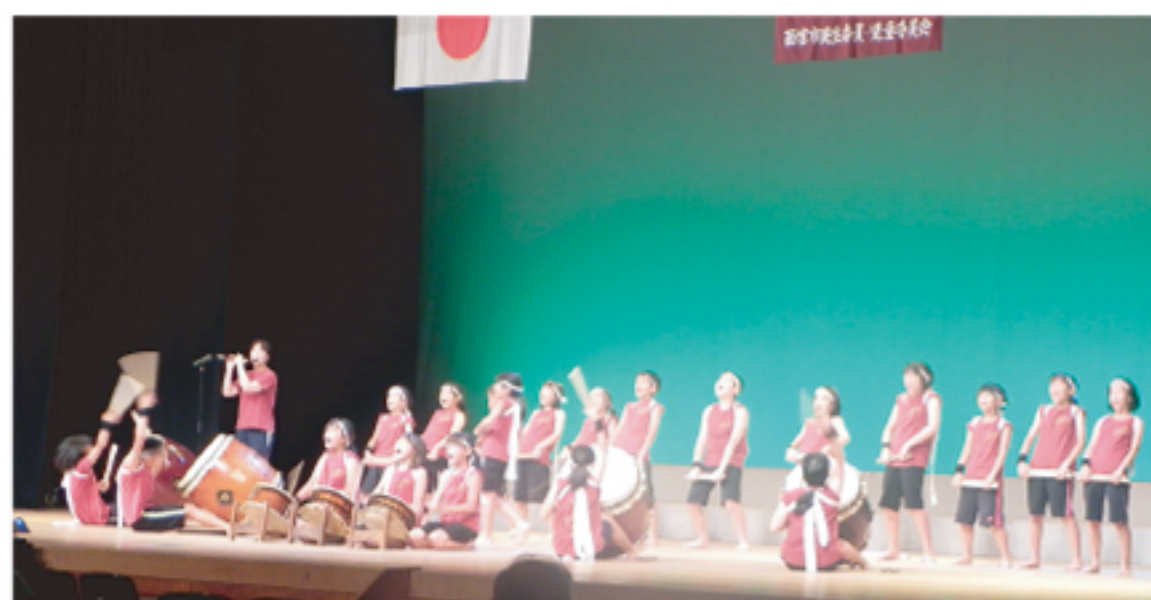
山口こども太鼓クラブ「祭」

そして、先達の皆様に敬意を表し、元理事には感謝状を授与させていただきました。この式典に花を添えたのは、山口こども太鼓クラブ、祭、学文中学校和太鼓部、上甲子園中学校吹奏楽部の三団体です。日々のたゆまぬ研鑽により心のこもった演奏を披露いただきました。先達が築いてこられた伝統を受け継ぐと共に、時代にあった活動を行い、次の世代につないでいく旨の大会宣言で締めくくりました。