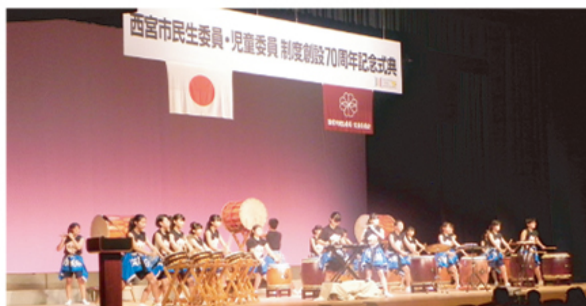
学文中学校和太鼓部