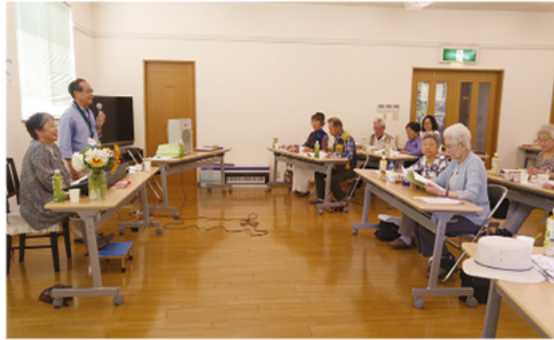
つどい場カフェで すみれ台式番館

高齢の人に「つどい場カフェ」を提供している地域もあります。映画鑑賞や、キーボードの伴奏でみんなが歌うなど、工夫を凝らして楽しんでもらっています。新島の住民が共存する地域ですが、民生委員・児童委員の活動は、ものの考え方や生活習慣の違いを越えて結束できる場のひとつではないかと思えます。より住みやすい地域になるように、これからも力を合わせて活動して行きたいと思っています。(藪 恵子)