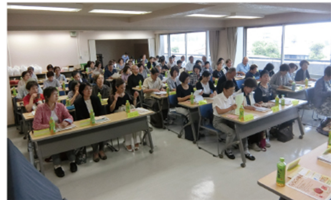
瓦木地区定例会の様子

研修会や講演会に参加することにより目まぐるしく変化する今の社会に委員として、住民にどのようにかかわっていくのかを学んでいます。他の地域の人と交流することで活動のヒントを得ることも多いです。社会福祉協議会(社協)、青少年愛護協議会(青愛協)、青少年指導委員活動などに参加し、地域活動を行っている委員もいます。自治会や社協の支援を受け、委員が中心となって