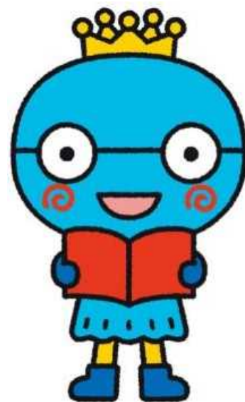
西宮市キャラクター