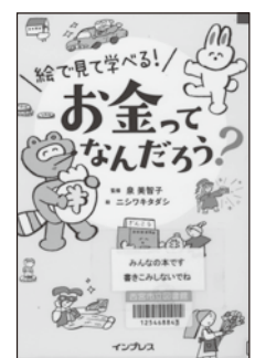
『絵で見て学べる！ お金ってなんだろう？』 泉美智子／監修 (インプレス、2021年)