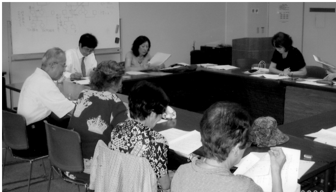
「事例検討会」(於：西宮市総合福祉センター)