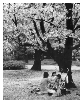
入選「お花見の親子」