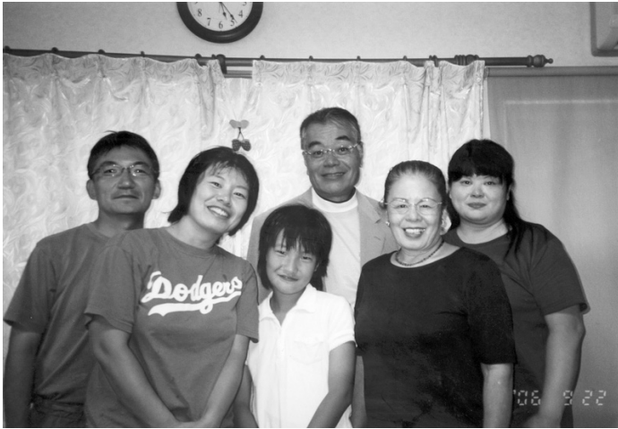
特選「わたしのかぞく」