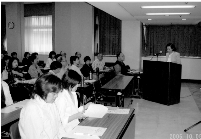
「公開講座『認知症へのかかわり』」 (於：西宮市民会館)