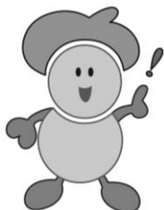
西宮市食育・健康づくりマスコット みやちゃん