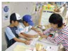
←ミニミニ水族館もあります!