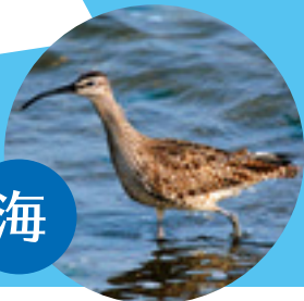
チュウシャクシギ