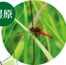
ハッチョウトンボ