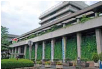
緑のカーテン（市役所）