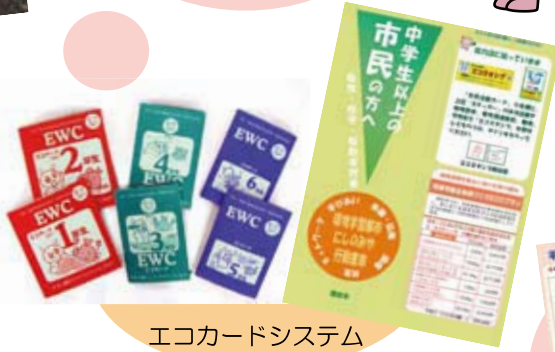
エコカードシステム