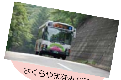
さくらやまなみバス

より詳しい情報はホームページをご覧ください。 西宮市ホームページ： http://www.nishi.or.jp/