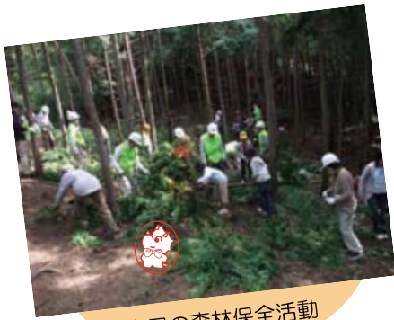
市民の森林保全活動