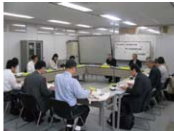
参画と協働による会議