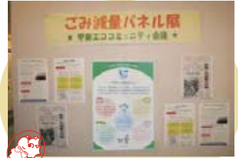
ごみ減量パネル展