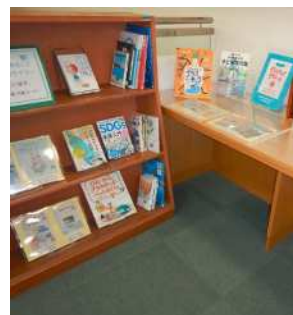
図1-4 環境ブックフェア

・本市における温室効果ガスの排出特性は、国や兵庫県に比べ、家庭部門が占める割合が高くなっています。このため、ライフスタイルの転換など家庭でのエネルギー消費量を削減する取り組みが重要です。地球温暖化への関心を持ってもらうため、事業者等と連携した体験型環境学習の実施、出前講座などを実施しています。令和3年度（2021年度）は、「省エネチャレンジにしのみや」として、省エネ行動の振り返り及び実践する省エネアクションキャンペーンと省エネ家電への買い替えを促進する家電の買替キャンペーンの2つのキャンペーン