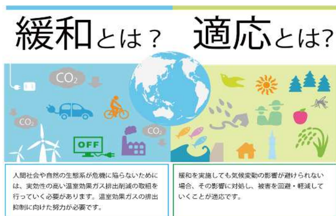
図 1-9 緩和策と適応策

本市では、「緩和」策のほか、多発する自然災害の対策として、防災に関する出前講座、防災マップの作成や自主防災組織への支援、浸水対策であるオンサイト・オフサイト貯留施設の整備、気候変動により増加の恐れがある熱中症・蚊媒介感染症に関する情報提供などの「適応」策を実施しています。