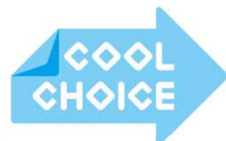
図 1-3 クールチョイスロゴ

・COOL CHOICE (クールチョイス) とは、二酸化炭素などの温室効果ガスの排出量の削減のために、省エネ・低炭素型の製品・サービス・行動など、温暖化対策に資する「賢い選択」を促す、国を挙げての国民運動です。本市においてもこの取り組みに賛同し、自ら取り組むとともに、市政ニュースやホームページなどで市民や事業者にも周知しています。