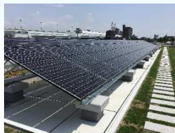
図 1-6 香榎園小学校の太陽光発電設備

・市有施設の新築や大規模改修を行う際には、太陽光発電設備を率先して導入することとしています。これまでに本市の公共施設 25 箇所(令和 3 年(2021 年) 3 月末現在)で太陽光発電設備を導入しています。また、環境学習用の太陽光発電設備を一部の学校に設置し、太陽光発電による発電量を表示するモニターを取り付け、児童への環境教育に役立てています。