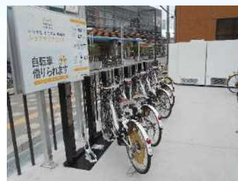
図 1-8 シェアサイクル

・近年、モノや場所、サービスなどを多くの人と共有する「シェアリング・エコノミー」という取り組みが進んでいます。モノや空間などを共有することで、資源を効率的に活用し、ごみの発生量や温室効果ガス排出量の削減といった効果があります。シェアサイクルは、環境負荷の低い自転車を「共有」することで温室効果ガスの排出削減や資源の有効利用につながります。本市では、令和元年（2019年）7月から民間事業者と共同してシェアサイクルの利用動向調査を実施し、事業の効果や継続性を検証しています。