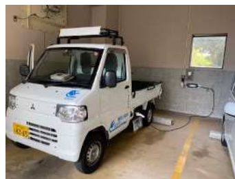
図 1-7 公用電気自動車

・電気自動車(EV)・燃料電池自動車(FCV)・プラグインハイブリッド自動車(PHV・PHEV)など環境にやさしい次世代自動車・バスの普及を促進しており、市の公用車においても、次世代自動車の導入を進めています。 ・低公害車の普及は、NO x 、PM等の排出ガス対策として有効ですが、二酸化炭素排出量削減による地球温暖化対策としての効果もあります。低公害車の普及促進を図るため、民間のバス・トラック事業者を対象としてCNG(圧縮天然ガス)自動車および優良ハイブリッド自動車購入時の補助金交付制度を設けています。