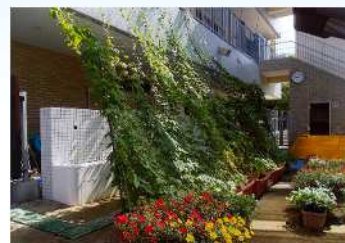
図 1-5 緑のカーテン

・誰でも身近で簡単に取り組むことができる、省エネなどエコな活動として「緑のカーテン」づくりの普及・啓発を行っています。令和3年度（2021年度）は、学校園などの公共施設へのカーテン用植物苗の配付による普及・啓発を行いました。また、緑のカーテン制作・維持管理についてのパンフレットを作成し、啓発事業などを行いました。