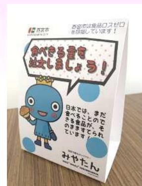
図 2-4 食品ロス削減の啓発ポップ

・市が備蓄している賞味期限の近い非常食を防災意識の啓発も兼ねて有効活用するため、小中学生に配布する取り組みを行いました。