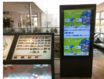
図 2-8 デジタルサイネージ

・令和2年（2020年）7月1日からレジ袋の有料化がスタートしました。この啓発の一環として、市内大型複合施設や鉄道駅にデジタルサイネージのポスターを掲出し、市内事業者と連携して市民に向けた啓発を行いました。