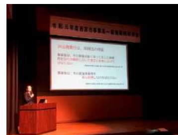
図 2-9 事業系一般廃棄物研修会 （令和元年度実施の様子）

・事業系廃棄物の減量と適正処理を推進するため、市内の大型複合商業施設の管理者へ廃棄物減量の協力依頼を行うとともに、テナント等へのアンケートの実施や、廃棄物減量に係る調査を実施しています。なお、令和3年度（2021年度）は新型コロナウイルス感染症拡大防止のため、店舗の休業などが相次ぎ実施できませんでした。