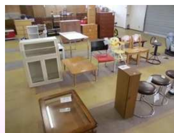
図 2-7 リサイクルプラザの様子

また、リサイクルプラザでは、毎年10月に粗大ごみの中から自転車や家具など簡単な点検や修理により使用可能なものを展示