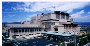
図 2-10 西部総合処理センター

・ごみの円滑な処理体制を維持するため、中間処理施設として、西部総合処理センター及び東部総合処理センターの管理・運営を行っています。この2施設に、家庭や事業所から排出される一般廃棄物を搬入し、焼却・破碎・選別などの中間処理及び資源化物の回収を行っています。