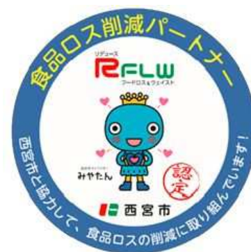
図2-3 食品ロス削減パートナー認定ステッカー

・資源物の回収促進、買い物袋持参運動、再生品の使用や販売など、ごみの減量化、再資源化に取り組む事業所をスリム・リサイクル宣言の店として指定し、市のホームページにて紹介しています。また、令和3年(2021年)10月には、「西宮市食品ロス削減パートナー制度」を創設しました。令和3年度(2021年度)は、60件の認定を行い、事業者と連携しながら事業系食品ロス削減について、さらなる啓発を進めます。