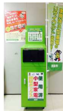
図2-2 使用済み小型家電回収ボックス

・ごみの減量、資源の有効利用及びごみ問題に関する意識の高揚を図るため、資源の集団回収を実施する団体等に対して、再生資源集団回収実施団体奨励金を交付しています。令和3年度(2021年度)は約9,200tを回収し、590団体へ奨励金を交付しました。