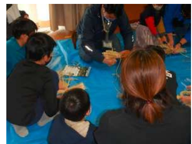
図 6-1 エココミュニティ会議でのしめ縄作りの様子

・地域に根差した環境活動の輪を広げるため、各地域で「エココミュニティ会議」の設置が進んでいます。同会議は、平成 17 年度（2005 年度）に学文地域で初めて発足して以降、順次増え続け、令和 3 年度（2021 年度）では市内 21 地域で設置されています。市は、同会議への助成や必要に応じた支援を行うとともに、各地域に設置された同会議が一堂に会し、情報交換を行う交流の機会を設けています。