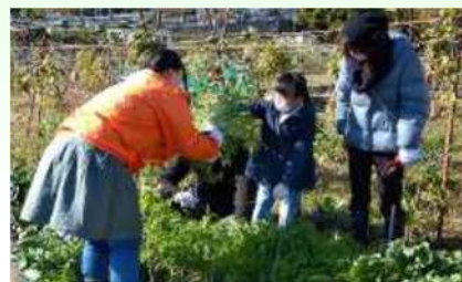
図 6-3 冬野菜の収穫体験の様子 (パートナーシッププログラム)

環境目標の実現に向け、事業者及び市民団体等の参画と協働による取り組みを促進するため、「環境学習都市にのみや・パートナーシッププログラム」を募集しています。認定された事業者等のプログラムについては、市広報媒体への掲載やエコカード・エコスタンプシステムとの連携などの支援を行います。