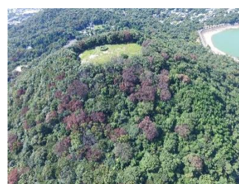
図 3-1 ナラ枯れ被害の様子

本市では、平成24年度（2012年度）に社家郷山キャンプ場周辺の2本のコナラで初めてナラ枯れの被害が確認されました。その後、平成28年度（2016年度）には、2,077本が確認され市内全域に被害が拡大しました。被害木については、危険木を中心に伐倒・くん蒸処理などを行っており、近年は減少傾向にあります。今後も引き続き経過観察が必要です。