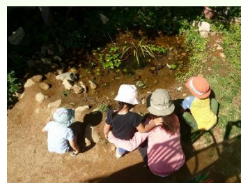
図 3-6 甲東北保育所の ビオトープ

・廃校となった小学校跡施設活用の一つとして、船坂里山学校においても、プール設備を活用したビオトープを一般公開しています。