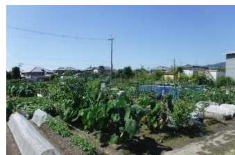
図 3-9 市民農園

「市民農園」とは、レクリエーションなどの目的で、小面積の農地を利用して野菜や花などを育て、食や農に親しむ農園（貸し農園など）のことをいいます。本市では、農家と地域の皆さんのふれあいの場として、また土に親しみ自然にふれる場として、令和2年度（2020年度）現在、市内5箇所にて200区画の市民農園を開設しています。