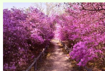
図 3-8 コバノミツバツツジ

・広田神社のコバノミツバツツジ群落は昭和 44 年（1969 年）に兵庫県の天然記念物に指定されました。市民主体の広田山コバノミツバツツジ群落保存会では、落ち葉かき、下草刈りなどを通じて、広田山コバノミツバツツジの保全活動を継続的に進めています。