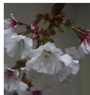
図 3-4 西宮市オリジナル植物 (宮の雛桜)

・夙川河川敷緑地には、樹齢百年を越える立派な松や、市の花である桜がたくさん植えられており、「さくらの名所 100 選」にも選ばれています。平成 22 年度(2010 年度)から市民ボランティア「きのこクラブOB会」、「ガーデンクラブ自主活動グループ バイオII」と協働で、松樹・桜樹の健全化事業を実施しています。また、植物生産研究センターでは、甲山湿原や社家郷山等に自生する野生植物を増殖・育成し、関連施