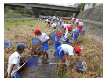
図 3-7 北夙川小学校の 環境体験事業

また、就学前後の子どもたちを対象にした遊び場であるみやっこキッズパークでは、田植えや稲刈りなども体験できます。なお、令和2年度（2020年度）は、新型コロナウイルス感染症拡大のため、各種体験イベントは中止となりました。