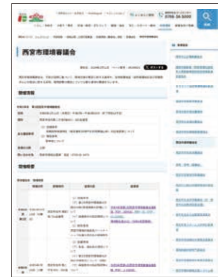
環境審議会(ホームページ)