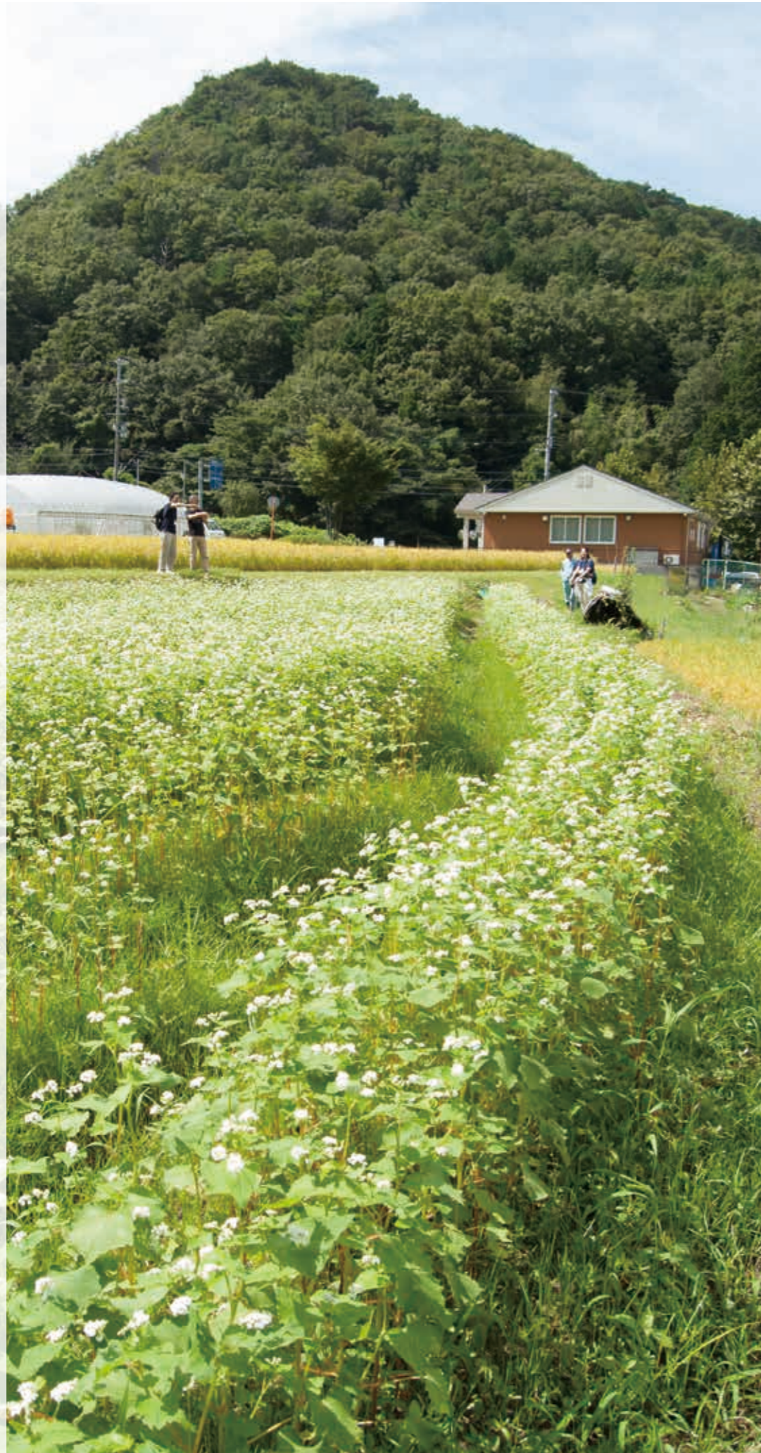
上の花:プレランサ(ブレクトランサス) 撮影地:船坂