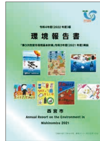
環境報告書(ホームページで公開)

毎年の取り組み状況や環境審議会からの助言について、年次報告書やホームページなどで情報を公開します。