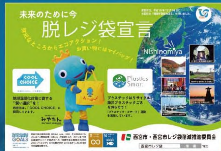
「SDGsトレイン未来のゆめ・まち号」(阪急電鉄・阪神電車)に掲出した啓発ポスター