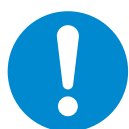
一般指示 General mandatory