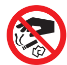
ポイ捨て禁止 No littering