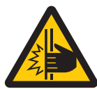
ホームドア： ドアに手を挟ま ないように注意 Caution,closing doors