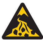
土石流注意 Warning;debris flow