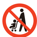
ベビーカー 使用禁止 Do not use prams / strollers (文字による補助表示が必要)