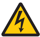
感電注意 Caution, electricity (文字による補助表示が必要)