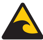
津波注意 Warning; Tsunami hazard zone