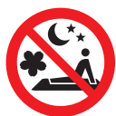
夜間花見禁止 区域 Night flower viewing party prohibited area