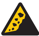
崖崩れ・ 地滑り注意 Warning;steep slope failure,landslide