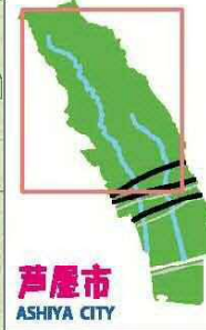
芦屋市 ASHIYA CITY