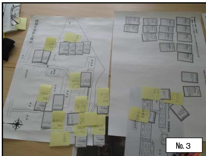
体育館や運動場の配置結果