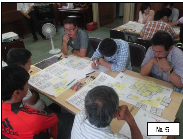
グループでの意見交換