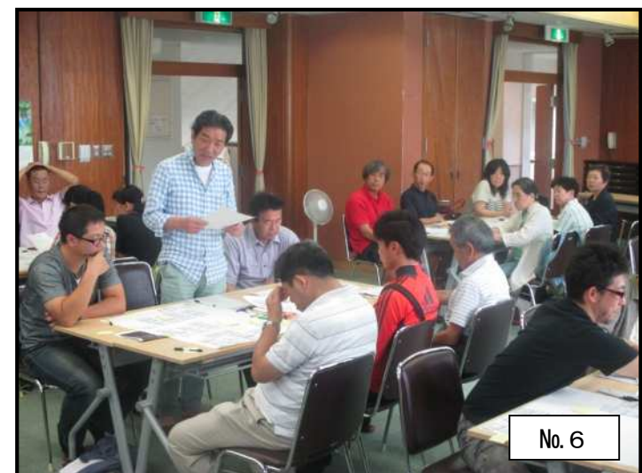
意見発表・意見交換