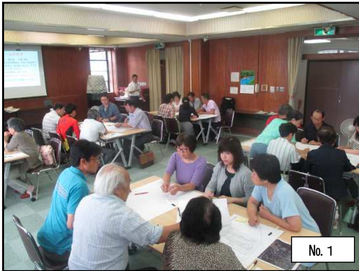
6～8名のグループに分かれて訓練開始