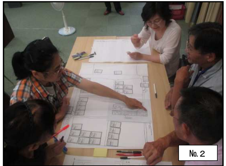
『避難者カード』等を平面図等に配置 (避難者を避難所に受け入れ)