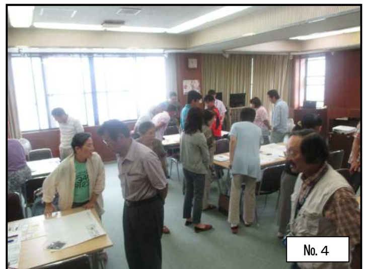
他のグループの配置結果を確認