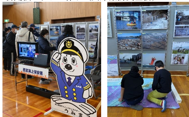
3D 海底地形図など（海上保安庁）