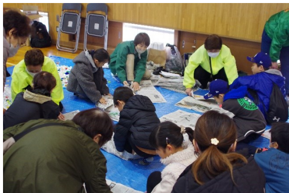
新聞紙スリッパ作り（兵庫県防災士会）