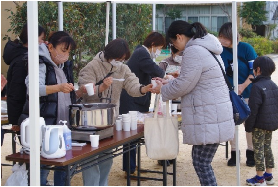
炊き出し訓練 (西宮マリナパークシティ協議会)