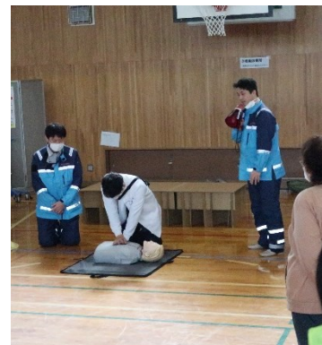
模擬診療所（医療ボランティア、鳴尾消防署浜分署、西宮浜サクラポート）