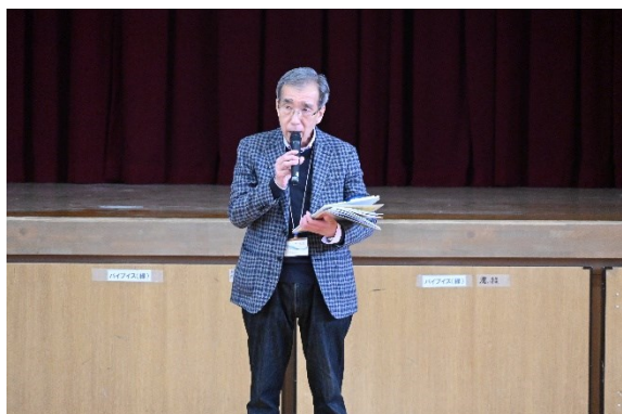
開会挨拶（協議会会長）