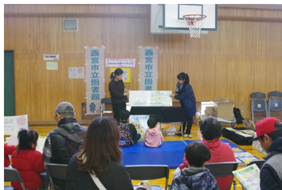
防災紙芝居&図書の貸出（読書振興課）