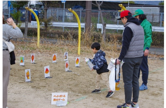
ペットボトル消火 (兵庫県防災士会)