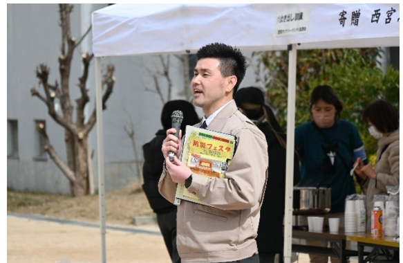
講評 (地域防災支援課)