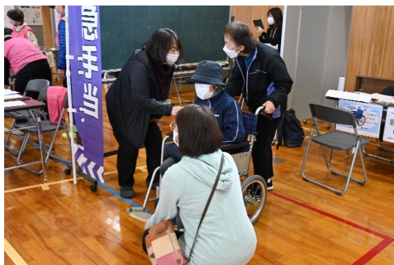
介助体験（西宮浜サクラポート）