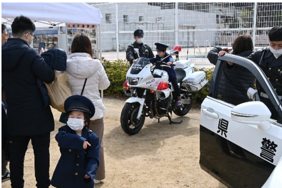
警察車両展示 (西宮警察署)