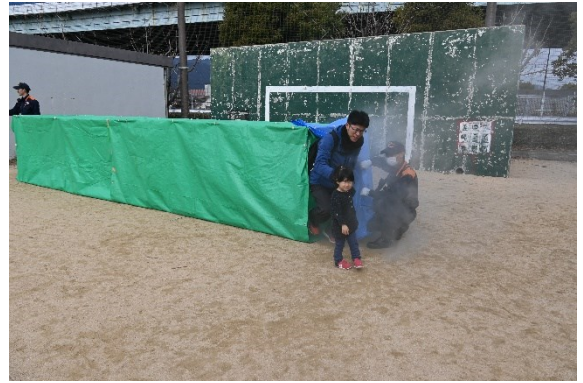
煙体験 (鳴尾消防署浜分署)