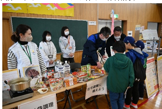
在宅避難の準備（コープこうべ）