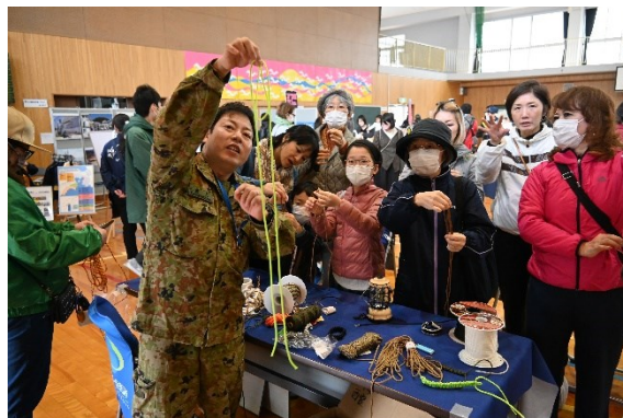
命綱になるプレスレット作り（自衛隊）