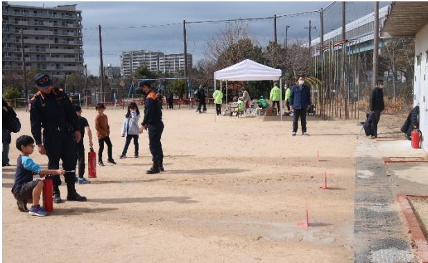
水消火器訓練 (鳴尾消防署浜分署)