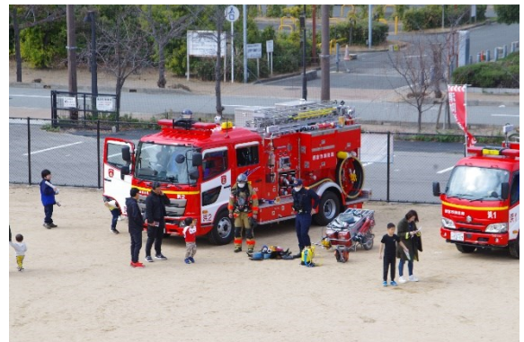
消防車体験 (鳴尾消防署浜分署)