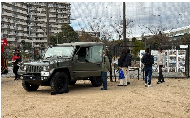
自衛隊車両体験 (自衛隊)