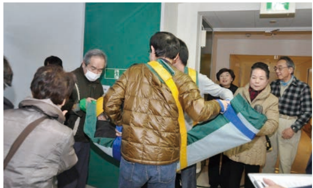
□ 福祉施設・病院における避難者受入れ訓練 避難者と連携した利用者搬送が行われました