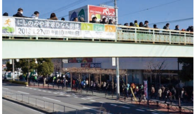
□ 津波が来る前に津波避難ビルやJR神戸線以北に避難する訓練