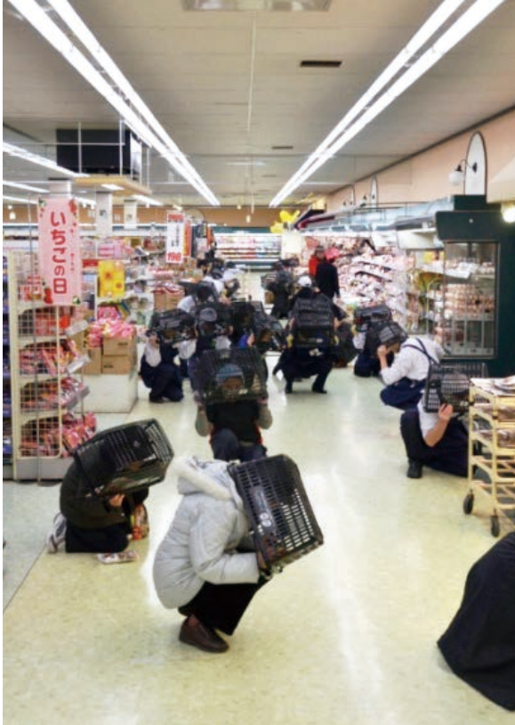
□ 地震の揺れから身を守る訓練(=シェイクアウト訓練) 「姿勢を低く!」、「体・頭を守って!」、「揺れが収まるまで待つ!」

障害者の団体や商業施設等の自主的な参加なども含め、延べ4万6,300人を超える方が参加しました。