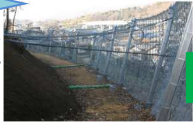
生瀬地区 落石防護柵 土砂捕捉状況

豊かな自然と便利さが叶う街西宮ですが、ひとたび災害に遭うと、被害は甚大です。このため、山合いには、災害を防止するための施設が数多くあります。