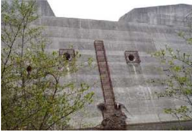
山口地区 東船坂堰堤 土砂捕捉状況