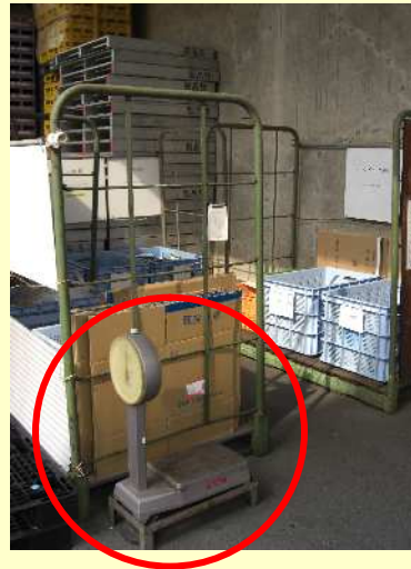
計量はかりで重量測定