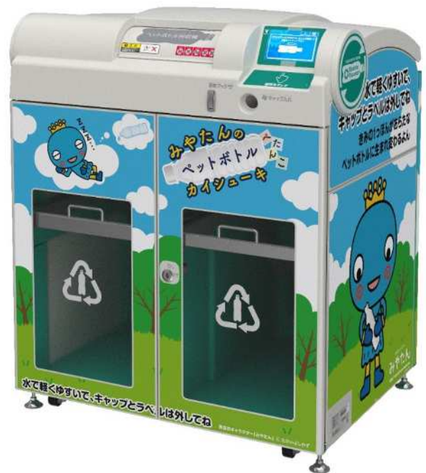
(ペットボトル減容回収機イメージ)