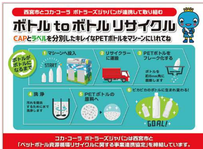
(啓発 POP イメージ)

ペットボトル減容回収機（株式会社寺岡精工社製ボトルスカッシュ DRV-200）を市役所本庁舎1階に設置し、来庁者および市職員等への適正なペットボトルの分別の意識啓発を推進します。