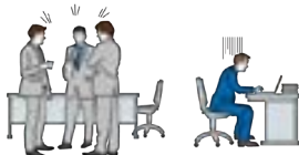
人間関係からの切り離し