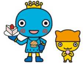
西宮市勤労者福祉協議会 みやたん & みにやっこ

（注意！） 規格に適合しない作品は、受付・展示できません。また、額装等の場合は、吊れる状態にしてご応募ください。