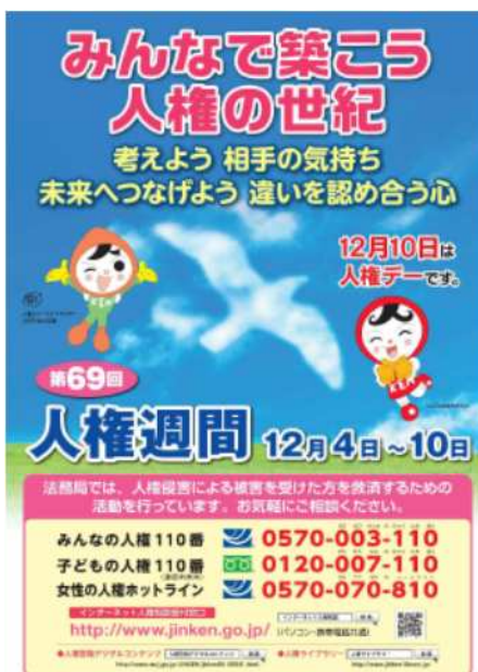
《第69回人権週間ポスター》

*レズビアン、ゲイ、バイセクシュアル、トランスジェンダーの頭文字をとった言葉。さまざまなセクシュアルマイノリティーの人たちを表す言葉のひとつとして使われる。