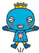
西宮市観光キャラクター みやたん

洋画、日本画、写真、書道、彫塑・工芸の各部門で合計69点が展示され、期間中576名の方々が会場を訪れました。