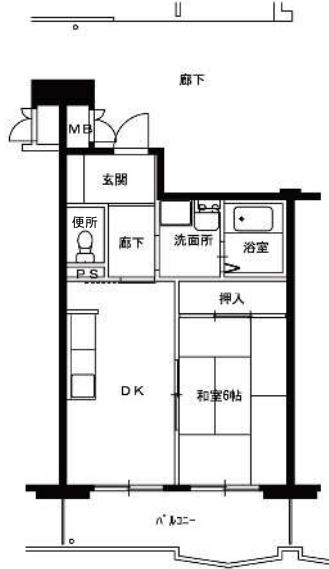
● 1DK : 42m 2