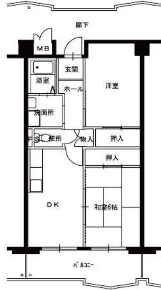
● 2DK-1 : 52m 2