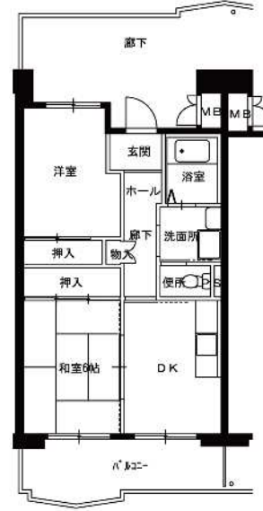
● 2DK-2 : 47m 2