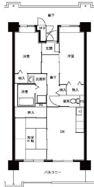
● 3DK : 64m 2 (L1) - 2・3号館