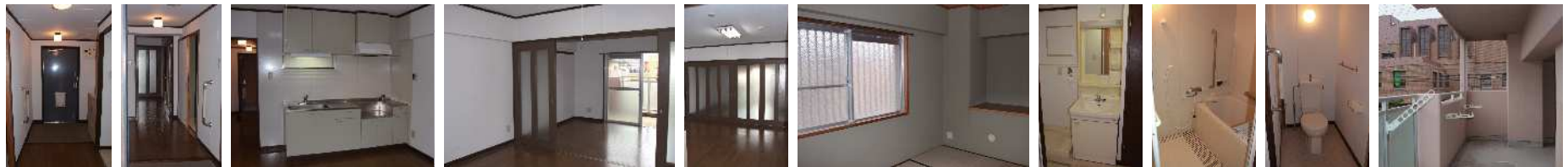
玄関 廊下 DK DK~洋室 洋室建具 和室 洗面所 浴室 便所 バルコニー