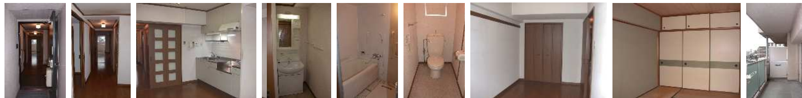
玄関 廊下 DK 洗面所 浴室 便所 洋室 和室 バルコニー