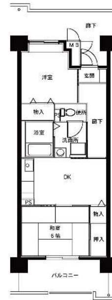
● 2DK : 48~49m 2 (M1) - 2・3号館