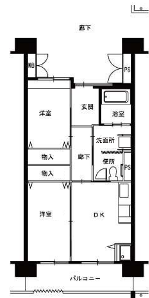
● 車イス2DK : 50m 2