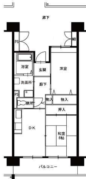
● 2DK : 49m 2