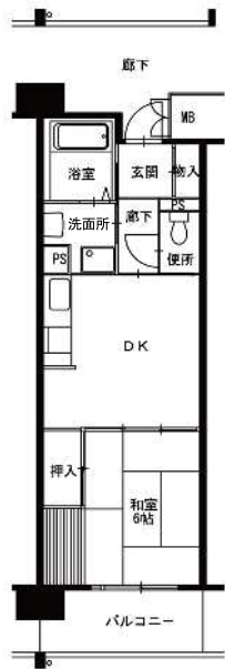
● 1DK : 39m 2