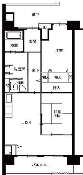
● 車イス2LDK : 65m 2