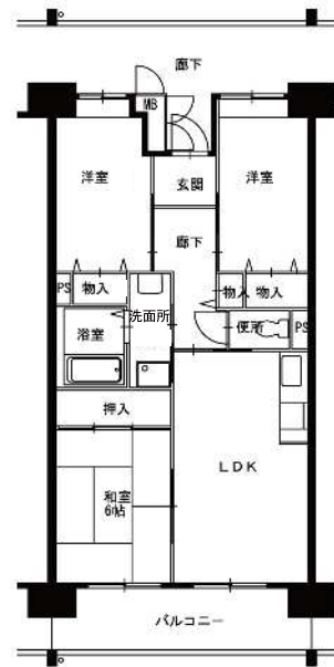
● 3LDK : 64m 2