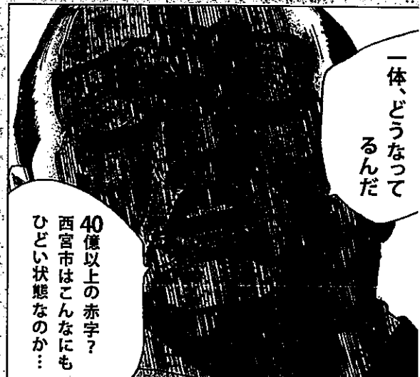
○タイトル: ブラックジャックによるしく、著作権名: 佐藤秀雄 ※著作権フリー素材使用

加えて資材高騰や人手不足による影響により、近年は公共施設整備のコストも軒並み上昇しており、今後の財政への見通しはさらに厳しいものになることが予想されます。