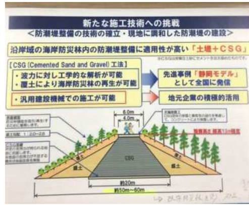
左上写真から防潮堤基礎工事写真（2枚）、津波マウンド、津波タワー、防潮堤整備・施工説明図