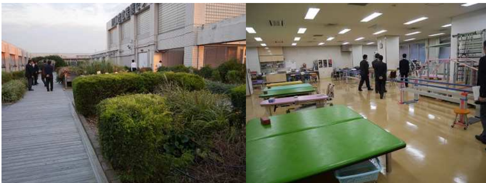
屋上緑化と広く整ったリハビリコーナー