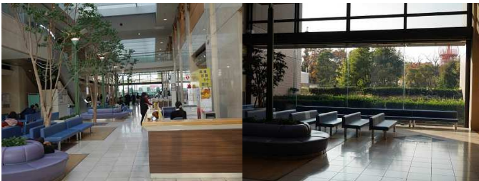
広く明るいエントランス