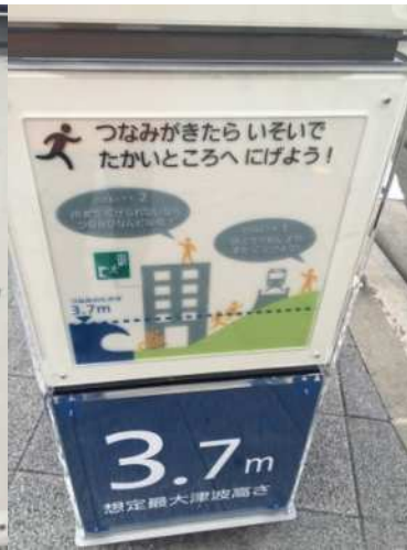
阪神西宮駅南側に設置された津波避難案内板（3枚）