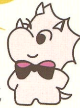
EWCキャラクター さとみちゃん