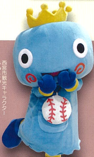
西宮市親善キャラクター みやたん