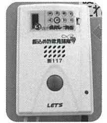
通話録音装置 (振り込め詐欺見張隊)