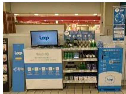
(Loop 店頭販売イメージ)

「Loop」は、従来使い捨て容器で販売されていた製品をリユース可能な容器で販売し、使用済み容器を回収して、洗浄・製品の再充填を行い、再び販売する循環型ショッピングプラットフォームです。日本では2021年5月にスタートして、現在、日用雑貨や食品メーカーなどが参画し、首都圏を中心とした「イオン」「イオンスタイル」75店舗にて行われています。ソーシャルエンタープライズの米テラサイクルが開発し、日本では子会社のLoop Japan 合同会社が運営しています。