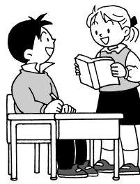
若い世代の意見を待ちしています

教育委員会は、4月に市立小・中学校に入学予定の幼児・児童の保護者に就学通知書を送付します。同通知書は、住民基本台帳・就学申請書をもとに送付します。1月末までに届かない場合は、