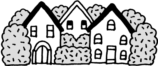
緑あふれるまちに

市は、緑豊かなまちづくりに向けて、民有地の緑化助成制度を設けています。問合せは花と緑の課(〒662-8567六湛寺町10-3 市役所本庁舎8階 ☎0798-353682)へ。