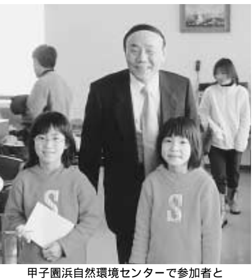
甲子園浜自然環境センターで参加者と

【日程・会場】3月7・8・9日(3日間コース)の午前10時から市役所東館8階で 【対象】次のいずれの条件も満たす人 ①45歳までの人 ②障害者に理解がある人 ③同研修受講後、3月中に市内事業所で行う実務研修に参加できる人 ④4月以降、市内事業所でガイドヘルパーとして勤務できる人 ホームヘルパー養成研修1・2級課程修了者は受講できません 【定員】80人