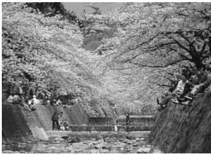
みごとに咲き誇る桜の下で春を満喫しましょう

西宮さくら祭が、4月6日を中心に夙川公園などで開催されます。今年で37回目になります。様々な舞台のほか、ウォークラリーなど野外イベントも盛り込まれています。問合せは市産業振興担当課内へ問合せを。