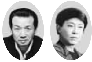
前川清さん 美川恵一さん

対象 16歳以上 定員 250組 本 番出場は20組 申込 往復八ガキ(1人1枚)に、歌う曲名(1曲)、その歌を歌っている歌手名、選曲理由、住所、氏名、年齢、性別、職業、電話番号を書き、7月7日(必着)までにNHK神戸放送局(〒650 851 5 神戸市中央区東川崎町1-2-2)の自慢出場係へ。多数の場合抽選 歌自慢集まれ!市とNHK神戸放送局は、「NHKの自慢」を8月3日午後0時15分から市民会館アミティホールで催します。予選会は8月2日午後1時から同ホールで、予選会の応募要領は次のとおり。問合せはNHK神戸放送局(078-371-8527)へ。