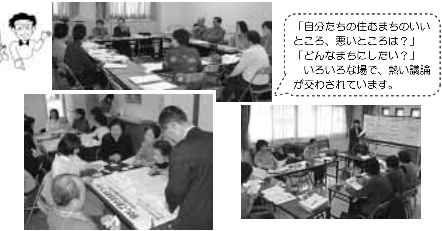
「自分たちの住むまちのいいところ、悪いところは？」 「どんなまちにしたい？」 いろいろな場で、熱い議論が交わされています。

現在の社協支部分区(概ね小学校区に設置)では、「住民の夢と希望をのせた計画づくり」を目標に、「第6次地域福祉推進計画(支部分区編)」(平成17～21年度の5カ年計画)の策定に取り組みんでいます。