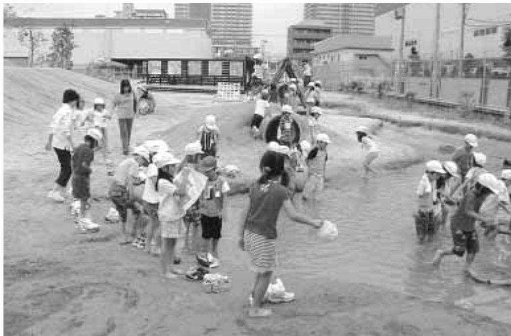
絵本とのであい...うぶ「子育て地域サロン」など