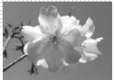
八重咲きの桜です

西宮市植物生産研究センター(北山緑化植物園内)は、市花である桜の研究を進めています。雲井町に自