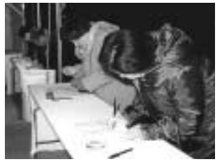
公園入口前に記帳所を設けます

市は1月17日に、阪神・淡路大震災による犠牲者を追悼するため、西宮震災記念碑公園(奥畑5番街区、二ツコ池東側)に記帳所を設けます。ご遺族や市民の皆さんが都合の良い時間に訪ねられ、哀悼の気持ちをささげていただけるよう、午前5時46分から午後4時まで設置します。献花をさ