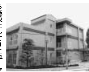
増築・改修工事を終えた学文公民館

施設としてリニューアルしました(右写真)。従来の建物に耐震補強を行い、3つの集会室(60・30・20人定員)を増築しました。また、エレベーターと障害のある人も利用できるトイレを新たに設置し、内外装も一新しました。施設は1月4日から使用できます。皆さんの学習